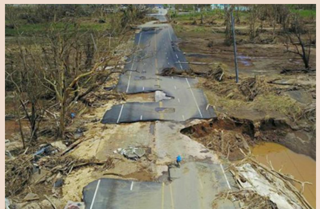
Imagen de las consecuencias del huracán. (El Nuevo Día).

Otras ayudas recibidas llegaron por parte de organizaciones norteamericanas y extranjeras, como Facebook. Esta llegó con el fin de ayudar a restablecer Internet, ya que el 90% de las torres de conexión que dotaban a Puerto Rico fueron derribadas por María. Las compañías de telefonía AT&T, T-Mobile y Claro llegaron a un acuerdo que beneficia a 2,5 millones de habitantes extendiendo sus períodos de comunicación abierta. Google dio Internet a Puerto Rico ubicando globos estratosféricos en puntos clave alrededor de la isla. Puerto Rico recibió fondos y subsidios de diversas agencias, como el Fideicomiso de Ciencia, Tecnología e Investigación, que donó 2.000 dólares para restaurar, restablecer y reparar el equipo de laboratorio; el Instituto Nacional de Salud