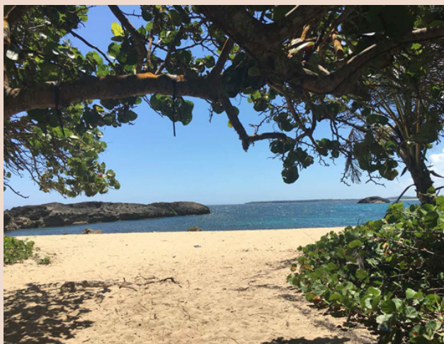
Puerto Rico. (Olga A. Figueroa Miranda).

ban a sentir esperanza. Las ayudas internas iniciaron la creación de programas y fundaciones, las comunidades comenzaron a organizarse por el bien común de ayudar a Puerto Rico a levantarse, a renacer. El sentido patriota brota en los puertorriqueños que viven en la isla. Nunca antes se había visto algo similar. Ahora se va por la calle viendo a miles de puertorriqueños ondeando su bandera en los coches, colocando la bandera en las casas, con pegatinas o camisetas entre otros tantos artículos. En medio de la catástrofe ¡le surgió al boricua sentido de pertenencia a su patria! Entre las iniciativas se encuentran Unidos por Puerto Rico, organización creada por la primera dama del país, señora Beatriz Rosselló, que recaudó 4,2 millones con un teletón para ayudar a damnificados del huracán María (Univisión Puerto Rico, 2017); Cáritas Puerto Rico junto a Iniciativa Puerto Rico España enviaron desde España cincuenta y cuatro cajas con medicamentos; Fundación Comu-