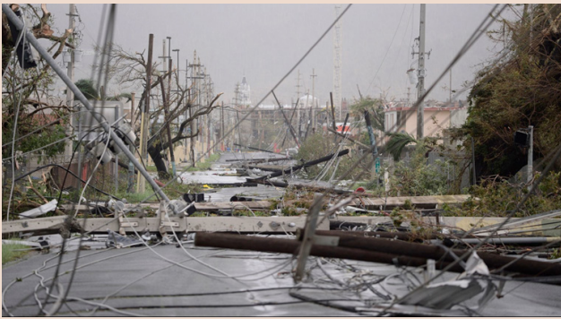
Imagen de las consecuencias del huracán. (El Nuevo Día).

E l 20 de septiembre de 2017, llegó a Puerto Rico el huracán más devastador para la isla en los pasados noventa años. El huracán María tocó tierra con vientos máximos de doscientos setenta kilómetros por hora, devastó la isla y resultó más catastrófico que los huracanes Hugo y George. Después de horas la isla quedó completamente en la oscuridad, sin los servicios básicos de electricidad y agua potable y sin comunicación alguna. Todo el tendido eléctrico en el suelo, puentes destruidos, carreteras colapsadas. Una devastación total que dejó a los 3,3 millones de puertorriqueños totalmente desolados, con hogares devastados, sin alimentos, desesperados por no poder comunicarse con familiares sencillamente para saber si estaban vivos.