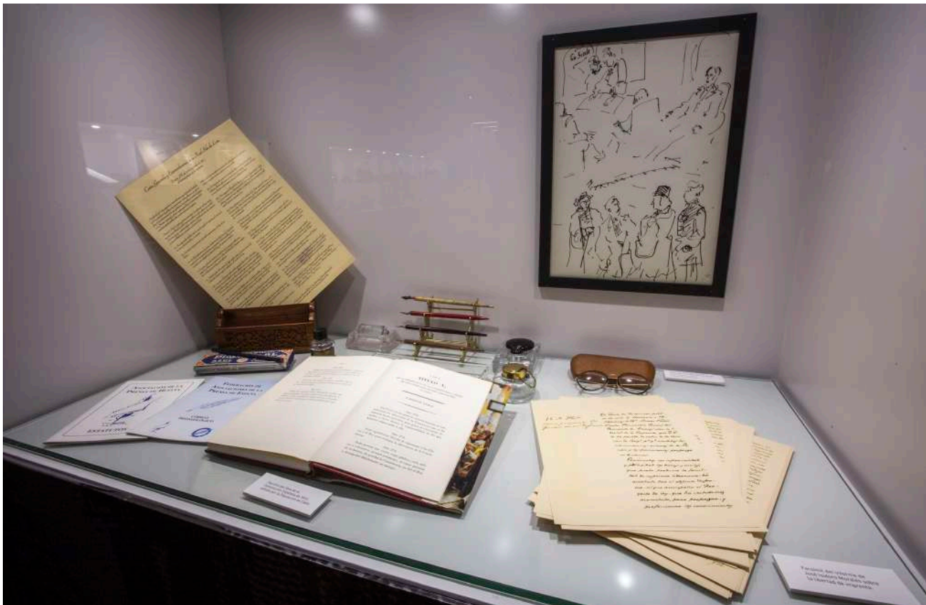
Un espacio del centro está dedicado a mostrar facsímiles de diversos documentos relacionados con el origen de la libertad de prensa en España y su inclusión en la Constitución de 1812.