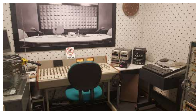
Estudio (o set) de radio analógico en el que se puede grabar unos minutos de audio y experimentar cómo se desarrollaban antes las emisiones.

El espacio dedicado a la radio muestra la evolución tecnológica que ha tenido este medio, en el que Huelva es pionera en nuestro país con la primera emisora con estudios de Radio Nacional de España, algunos de cuyos elementos se han podido rescatar y exponer. También se muestra un estudio analógico de radio, en el que los visitantes pueden sentir la experiencia de sentarse ante el control y grabar unos minutos.