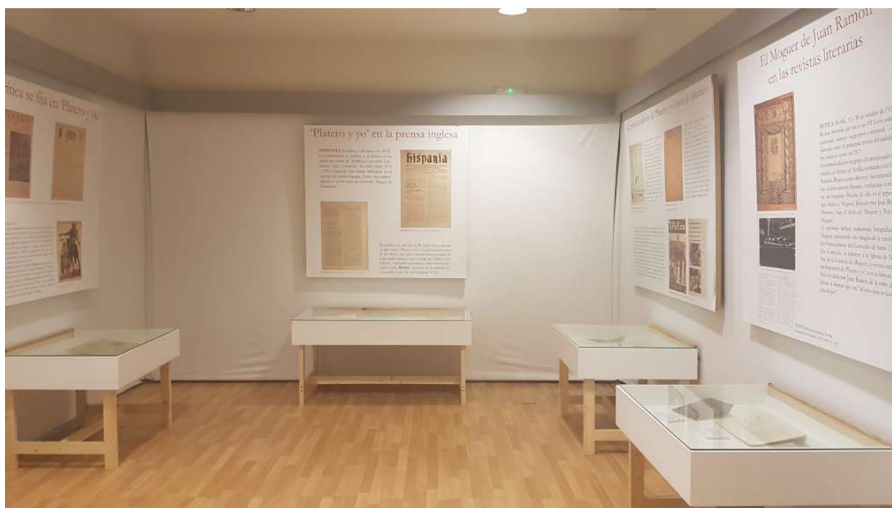
El Centro de la Comunicación Jesús Hermida acoge diversas exposiciones temporales.

En la transición hasta un set de televisión, dotado con todos los elementos necesarios para simular la grabación de un programa, se encuentra el espacio dedicado a Jesús Hermida y la Luna. En él hay objetos y documentos únicos relacionados con la aventura espacial y la retransmisión que el periodista realizó de la llegada del hombre a la Luna el 21 de julio de 1969. La grabación original se proyecta con la autorización de la NASA y TVE.