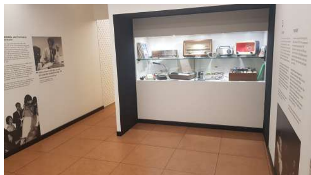
Una de las salas está dedicada a la evolución de la historia de la radio, a la que el periodista onubense Jesús Hermida estuvo tan ligado.

Con el lema «Conocer para comprender», el Centro de la Comunicación Jesús Hermida pretende ayudar a entender la evolución de los medios de