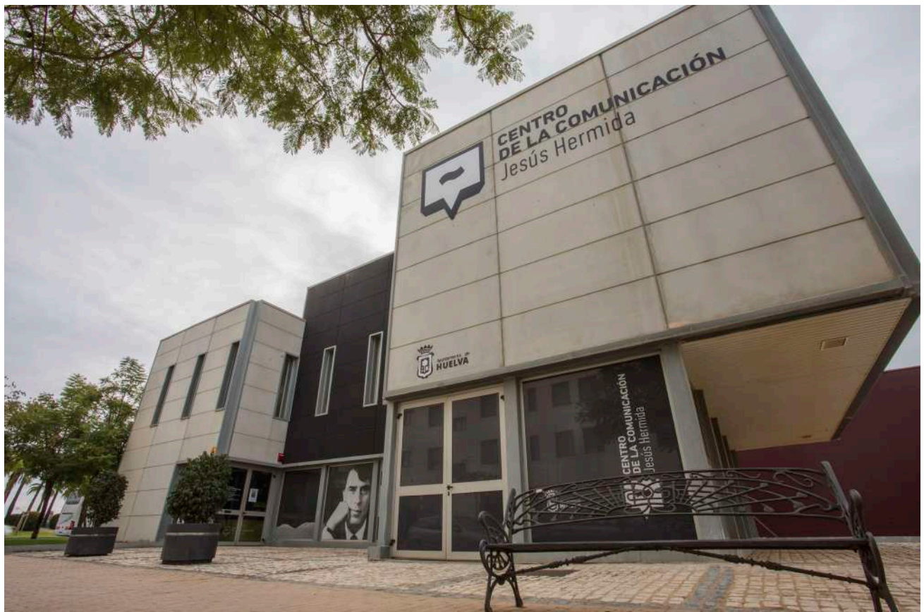
La Asociación de la Prensa y el Ayuntamiento de Huelva han unido esfuerzos para abrir el Centro de la Comunicación Jesús Hermida.

tigación necesario en una época en la que las redes imponen una nueva forma de entender la comunicación y las herramientas digitales dominan la forma de comunicarse poniendo a nuestra disposición infinitas fuentes de información, aunque, sin embargo, se constata una creciente confusión al distinguir entre qué son las herramientas de comunicación y los medios de comunicación, lo que provoca en el ciudadano un evidente aturdimiento en su capacidad para asimilar con sentido crítico los contenidos a los que tiene acceso.