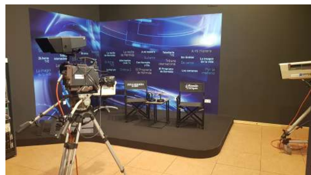
El set o estudio de televisión también rinde homenaje a Jesús Hermida.