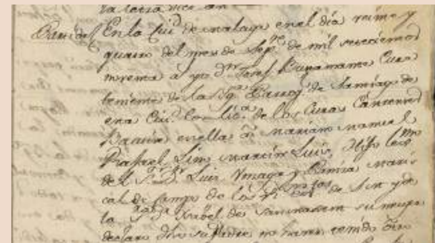
Detalle de la partida de bautismo de Mariano. (Expediente personal, 1802). / Detail of Mariano's baptism certificate (Personal File, 1802).