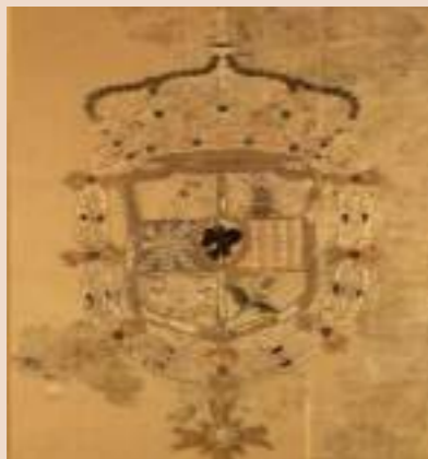
Bandera del Sexto Regimiento de Málaga del ejército bonapartino. (Museo Naval de Madrid, 1810, núm. 664). / Málaga 6th Regiment flag of the bonapartino army (1810, Museo Naval de Madrid, n° 664).