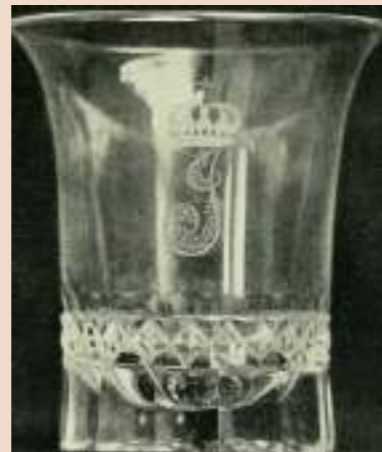
Vaso con que Bonaparte obsequió a Maitland. (Maitland, 2019, p. 202). / Cap that was gifted from Bonaparte to Maitland (Maitland, 2019, p. 202).