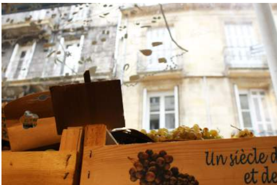
Quelques emplettes rapportées de l'épicerie place Sainte-Colombe viennent agrémenter la table dressée à l'occasion d'un déjeuner cours de l'Yser.