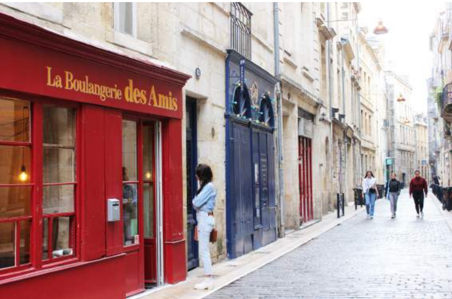
La matinée se poursuit par une virée à la boulangerie rue Teulère.