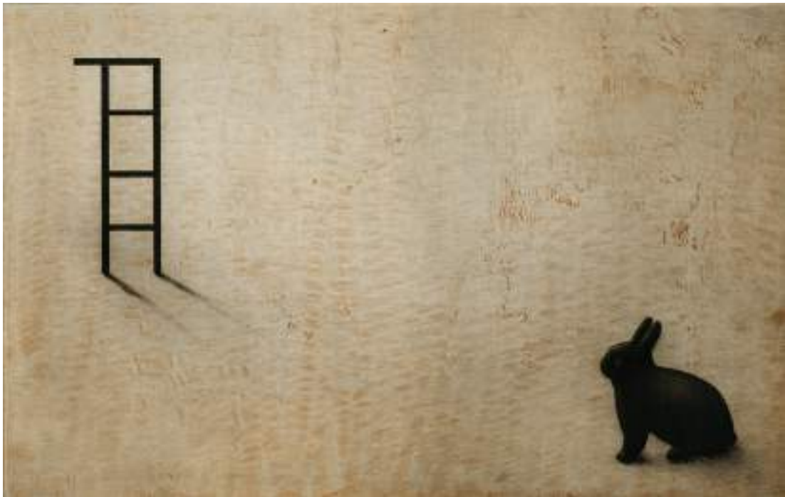
Al límite ( grabado ).