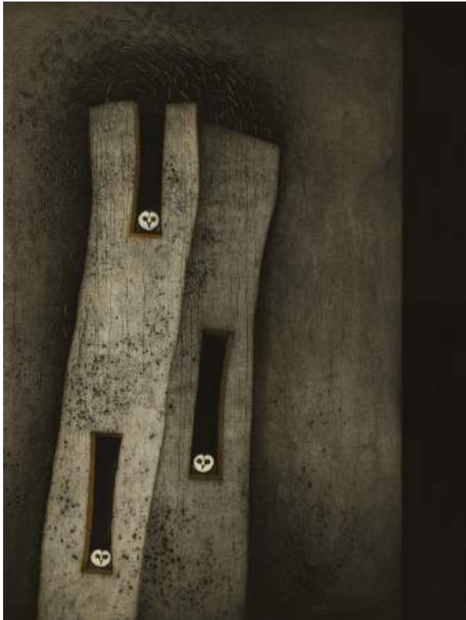
Otros hábitats ( grabado ).