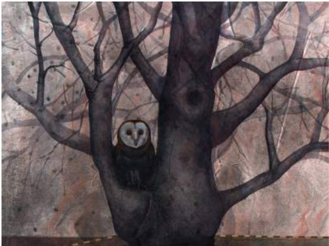
Árbol y lechuza ( pintura ).