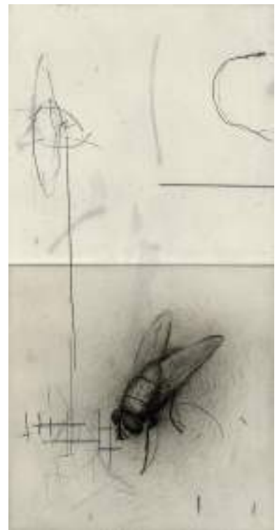
Insecto alado ( grabado ).