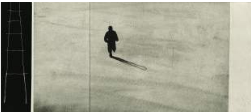
Huida al vacío ( grabado ).