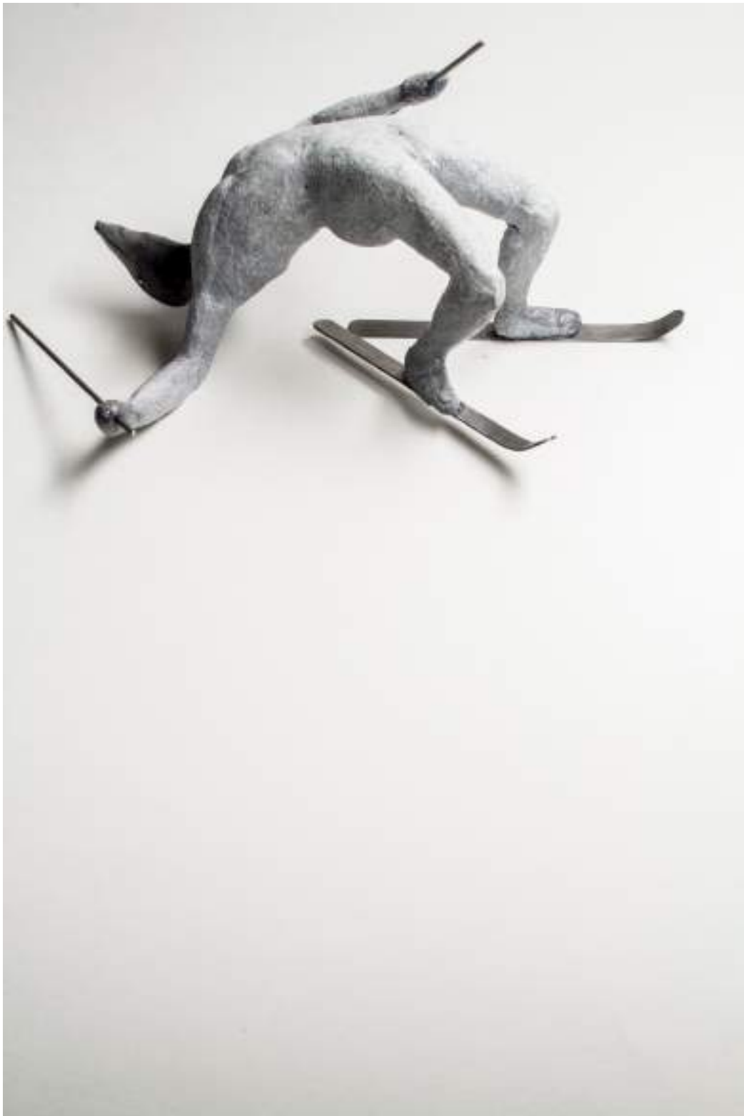
Primer vuelo (escultura, papel maché).