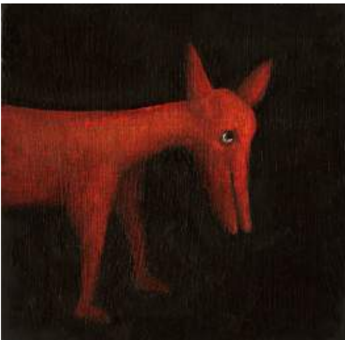
Mundo Gominol ( pintura ).