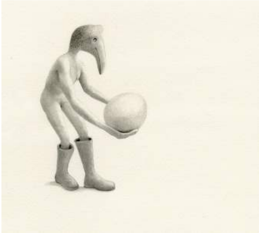
Traslado ( dibujo ).