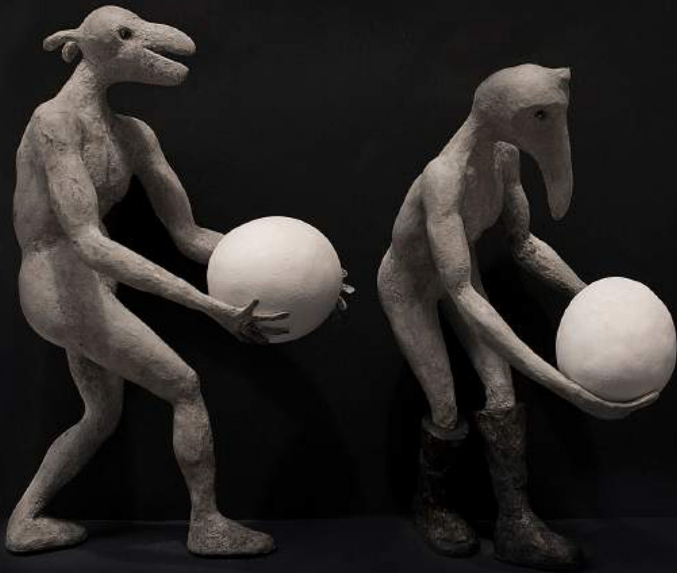
Traslado Gominol ( escultura, papel maché ).