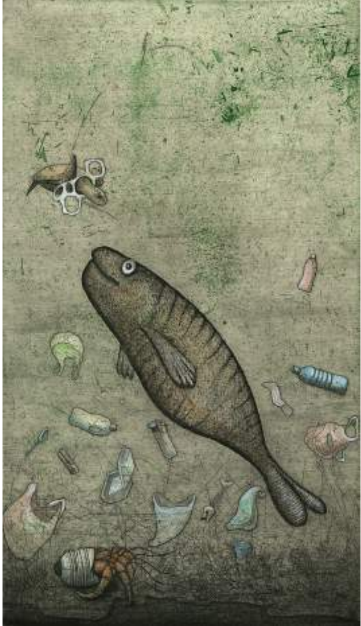
Plastic menu ( grabado ).