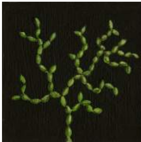
Mundo Gominol ( pintura ).