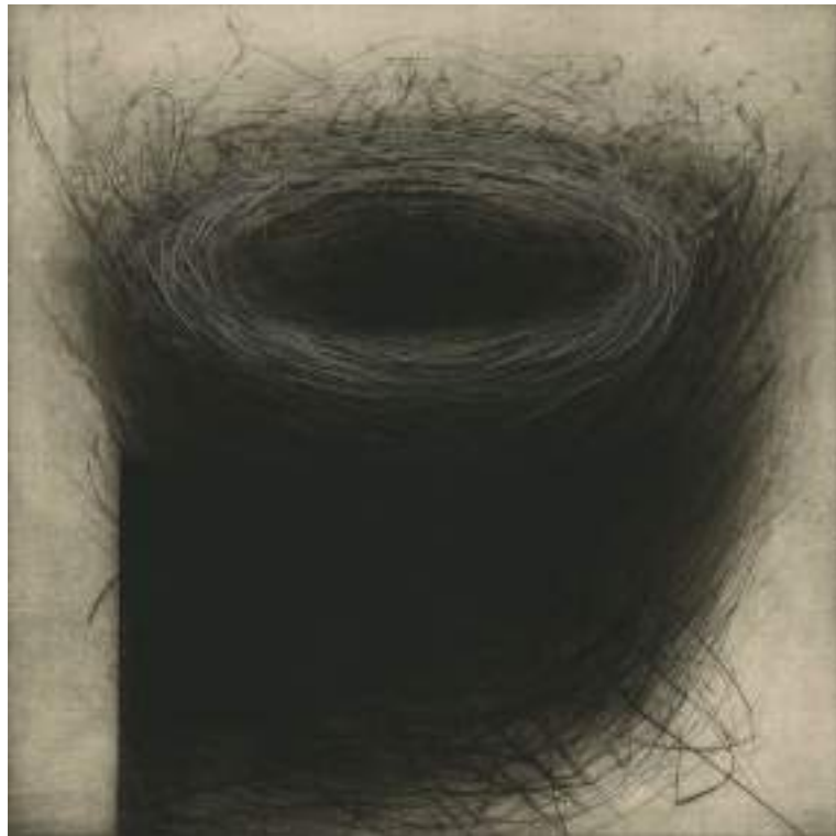
Nido ( grabado ).