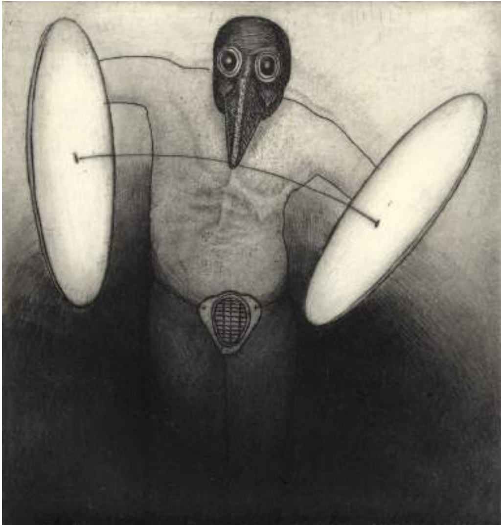
El gran mercader ( grabado ).