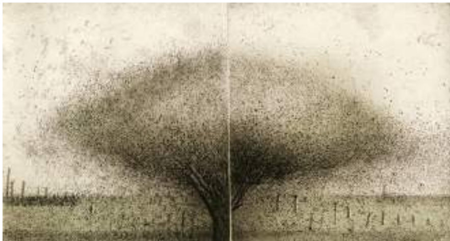
Árbol ( grabado ).