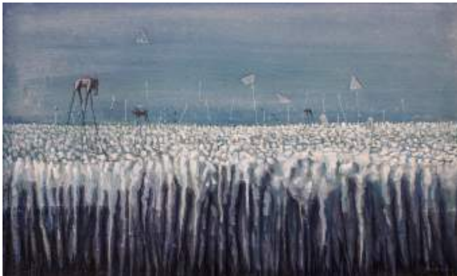
Zancudos ( pintura ).