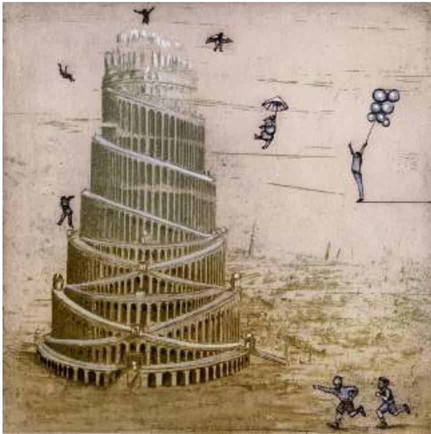
En torno a Babel ( grabado ).