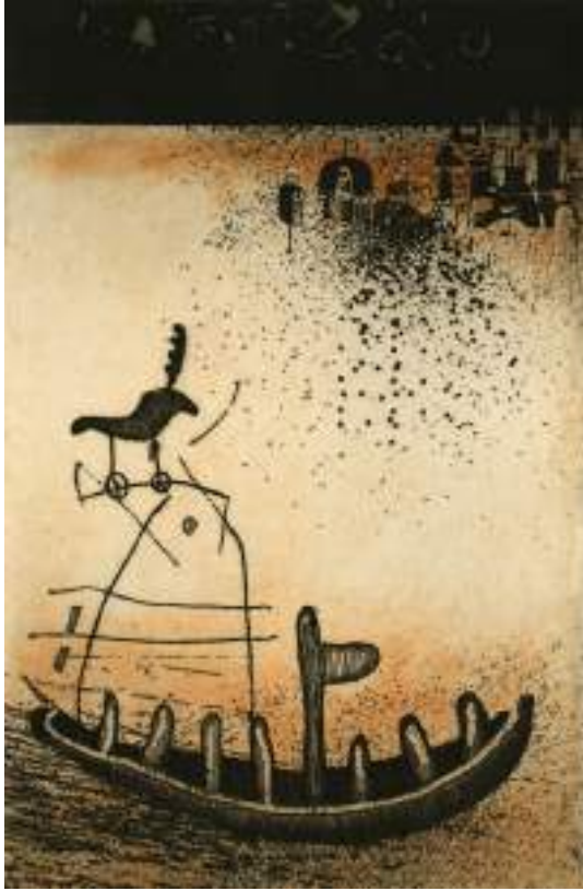
Caballito y barcaza ( grabado ).