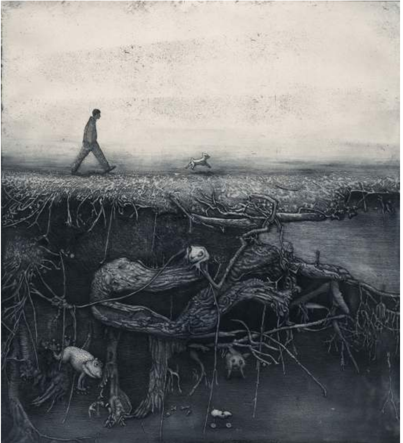
Blue Velvet ( grabado ).