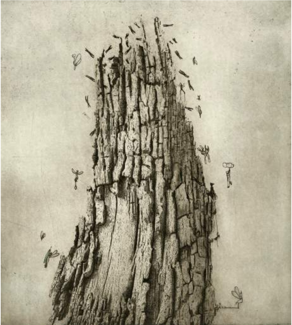
La última hoja ( grabado ).