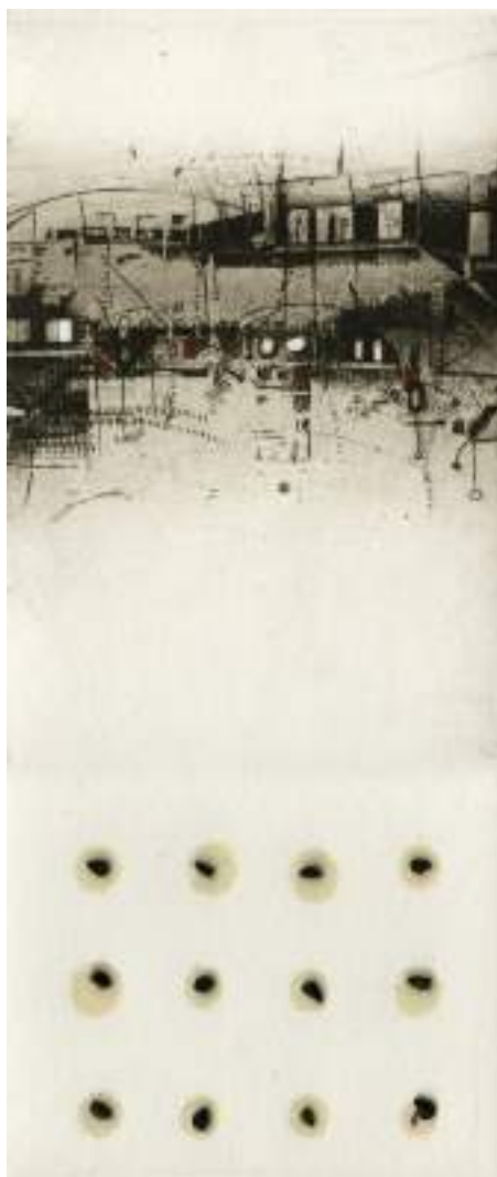
Arquitectura I ( grabado ).