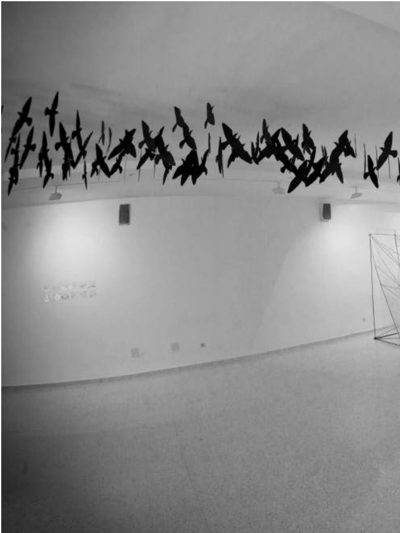
Otros hábitats ( instalación ).