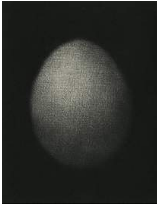
Huevo ( grabado ).