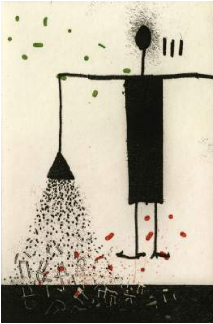
Fecundador ( grabado ).