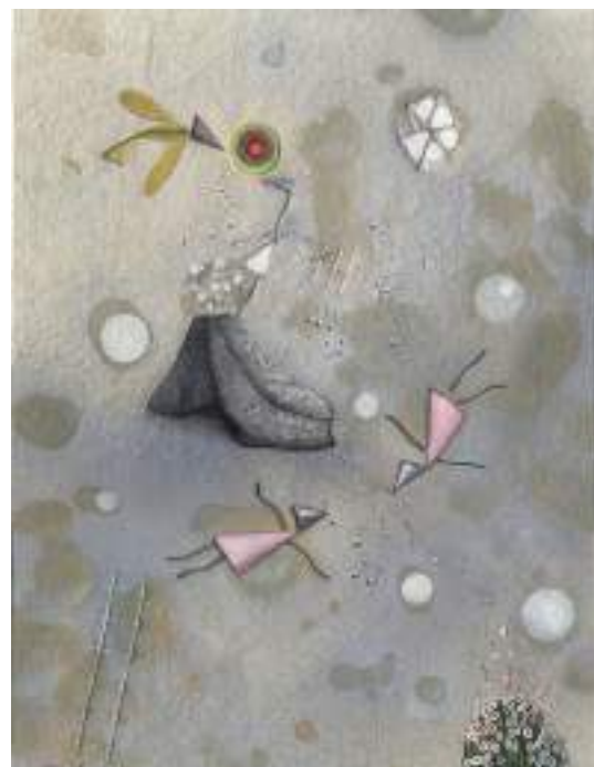
Espigadoras ( pintura ).