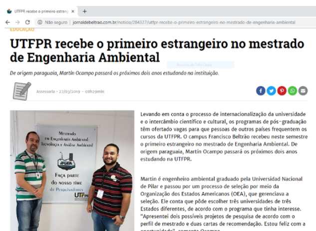
FIGURA 3 – INTERNACIONALIZAÇÃO NA UTFPR-FB

Nesse contexto verificamos que o discurso (Foucault, 2014a) da internacionalização atingiu o acadêmico paraguaio e as mídias, como segue a imagem abaixo.