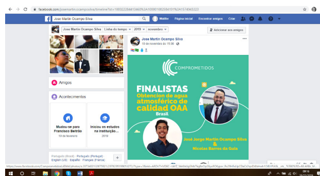
FIGURA 4 – FINALISTAS COMPROMETIDOS